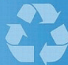
ГРАФИК ПРИЕМА ОПАСНЫХ ОТХОДОВ НА ПЕРВОЕ ПОЛУГОДИЕ 2014 ГОДА

Ваши отзывы, замечания и предложения направляйте по электронной почте: luminlampy@yandex.ru