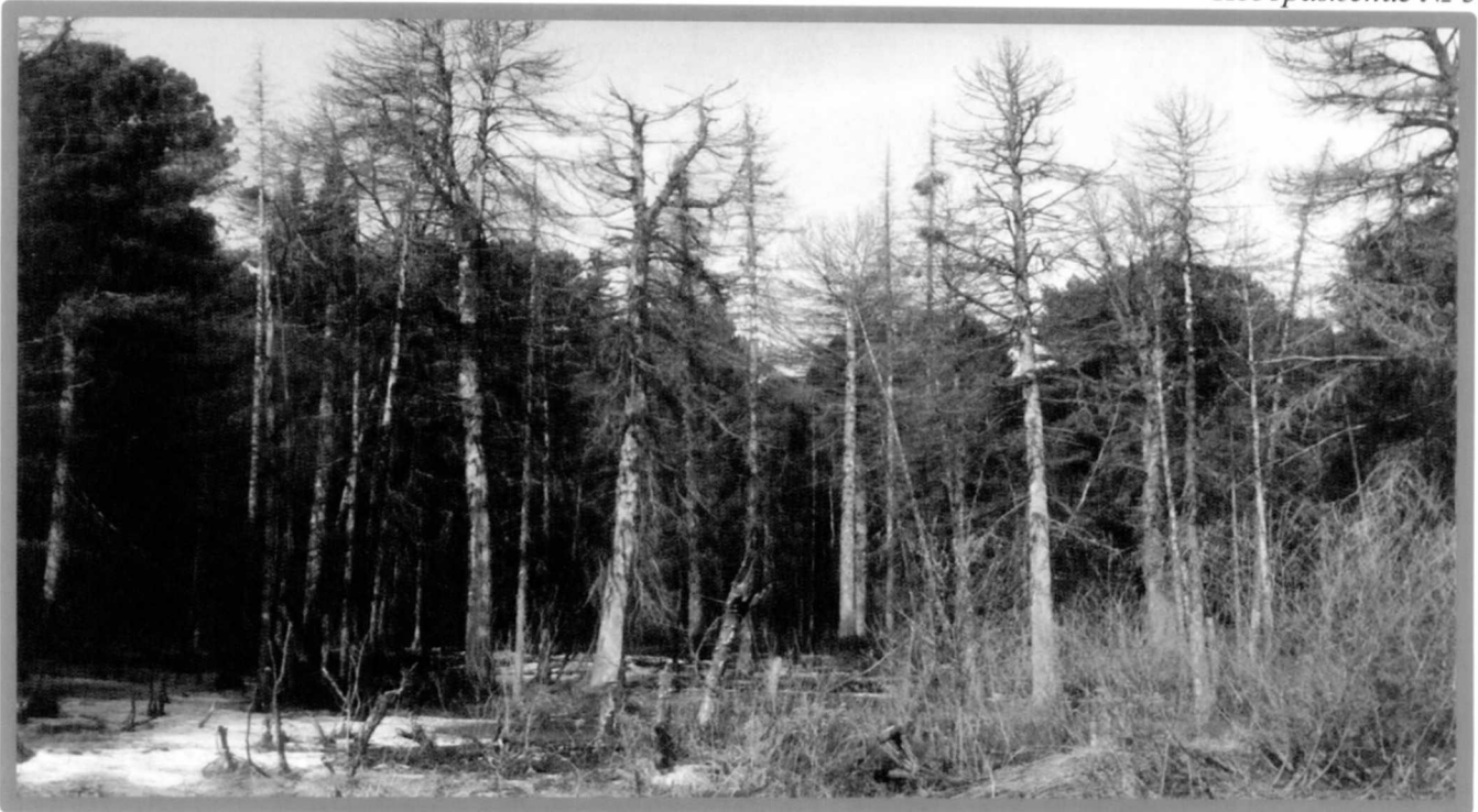
Изображение № 4 Сухостойное дерево. Не является валежником Изображение № 5

Кроме того, необходимо обратить внимание, что деревья, которые лежат на земле, но не имеют признаков естественного отмирания (имеют зеленую листву или хвою), определять как «мертвые» не допускается (смотри изображение № 5).