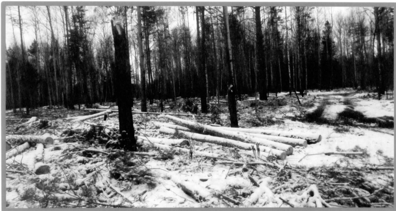
Изображение № 7 Брошенная древесина вдоль лесовозных дорог. Не является валежником