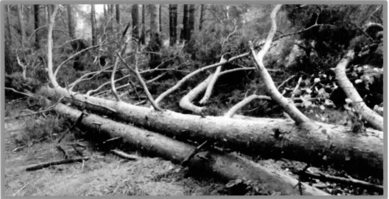
Лежащее на поверхности земли ветровальное дерево, не имеющее признаков отмирания. Не является валежником

Кроме того, необходимо обратить внимание, что деревья, которые лежат на земле, но не имеют признаков естественного отмирания (имеют зеленую листву или хвою), определять как «мертвые» не допускается (смотри изображение № 5).